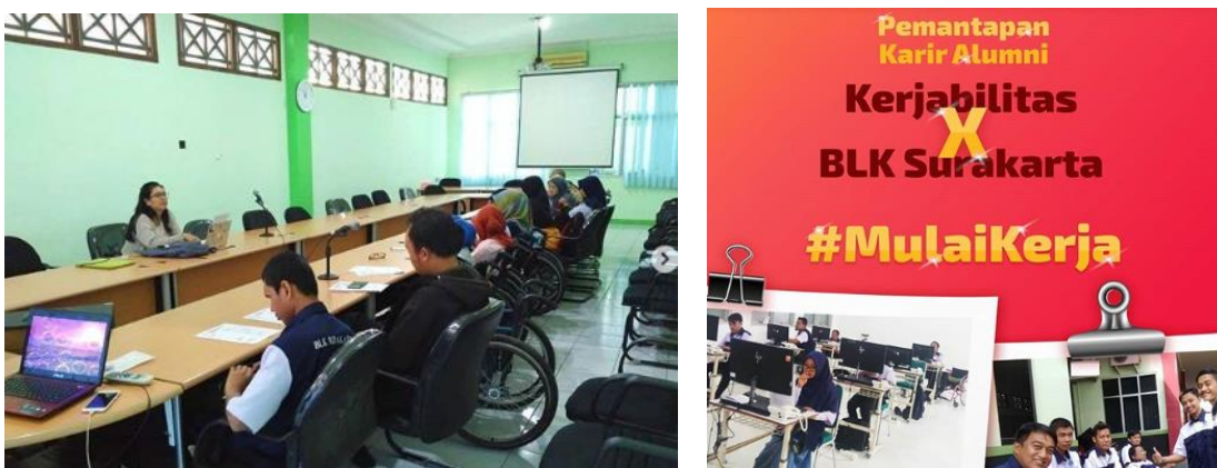
Gambar 2. Pemantapan Karir Alumni, dari Instagram @kerjabilas, 2019